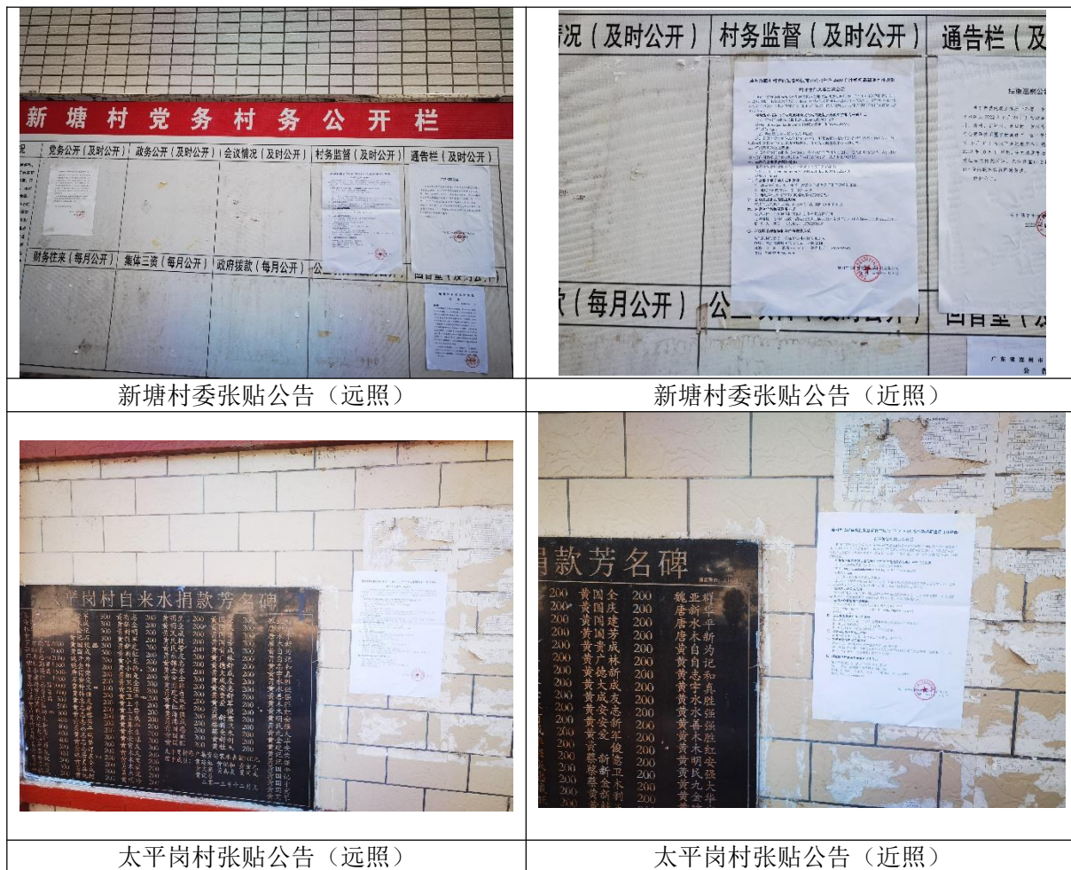
新塘村委张贴公告（远照）