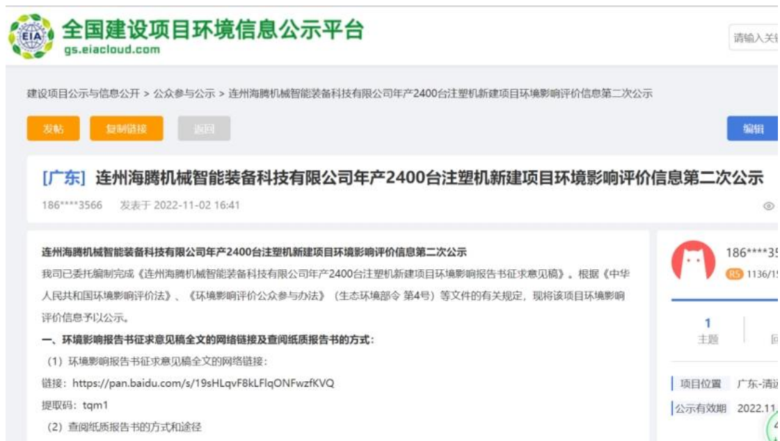
图 3.2-3 第二次网上公示截图

项目公示报纸公开情况见图 3.2-4、3.2-5。项目第一次报纸公开日期为 2022 年 11 月 4 日，第二次报纸公开日期为 2022 年 11 月 11 日，均刊登在《清远壹周》报纸。