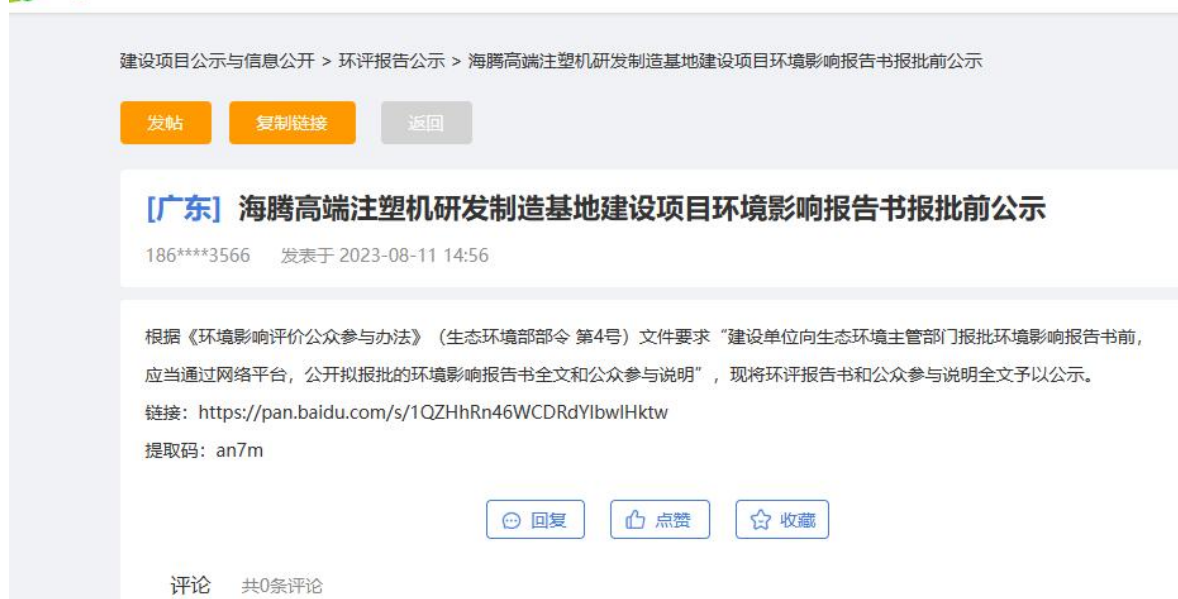
图 5-1 环境影响报告书报批前公示截图