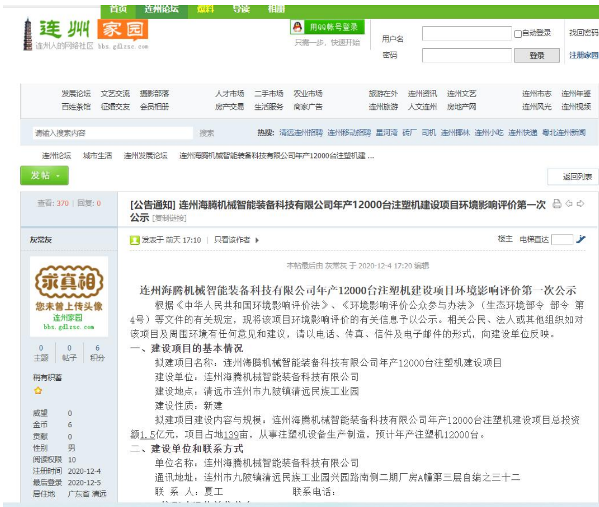
图 3.1-2 第一次网上公示截图